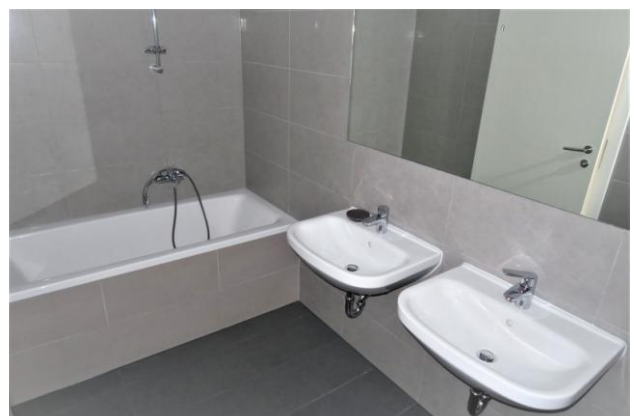
Zwei Waschtische und Wanne