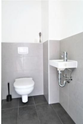
separates WC mit Handwaschbecken